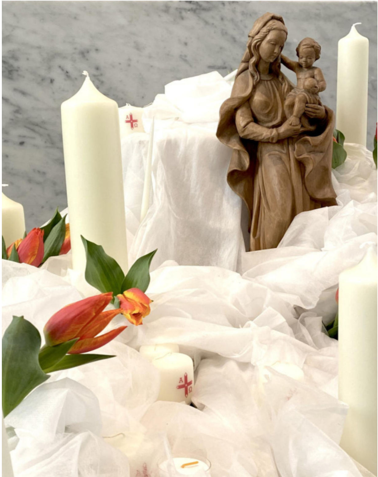
Bild: Sylvio Krüger, Darstellung des Herrn (Mariä Lichtmess) In: Pfarrbriefservice.de