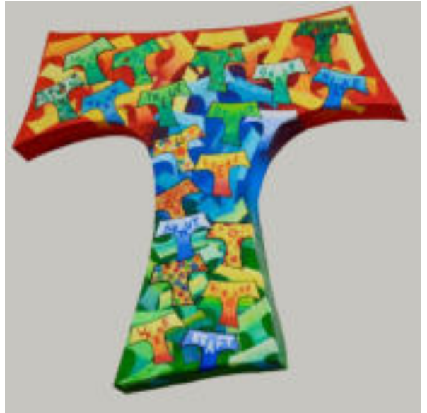
Bild: Ute Quaing / Plastik: Jürgen Schierenberg In: Pfarrbriefservice.de