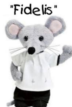
Das Maskottchen der Ministranten sagt Danke!