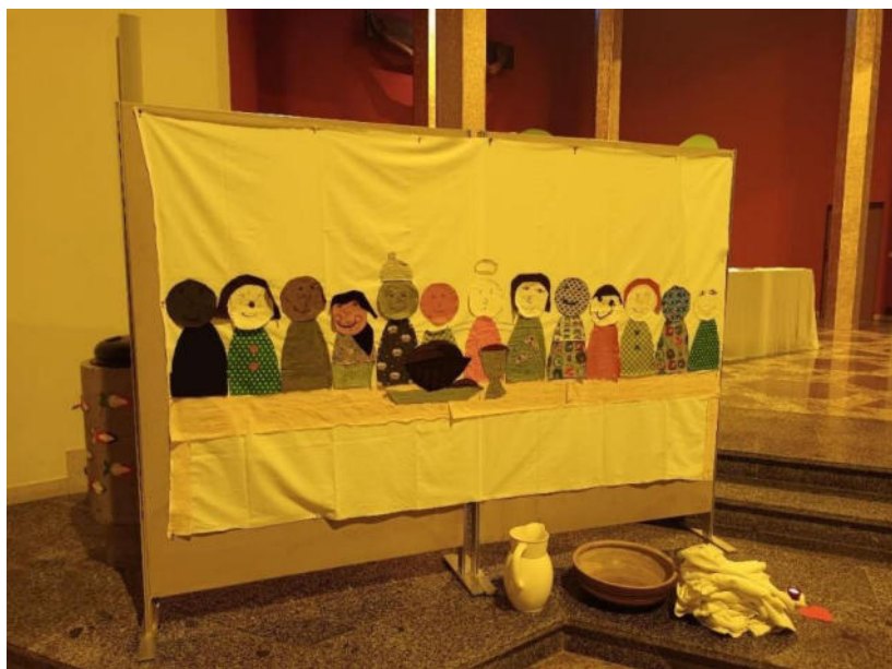
„Abendmahl“, von den Erstkommunionkindern unserer Gemeinde gestaltetes Bild

In diesem Jahr können wir auf 38 Jahre Gemeindezentrum St. Marien zurückblicken. Dies wollen wir mit einer Heiligen Messe am Freitag, dem 13. Mai um 18:00 Uhr feiern. Anschließend laden wir zu einem gemütlichen Beisammensein ein. Die Südbläser werden uns dabei musikalisch begleiten.